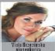
Viola Brzeska pianistka